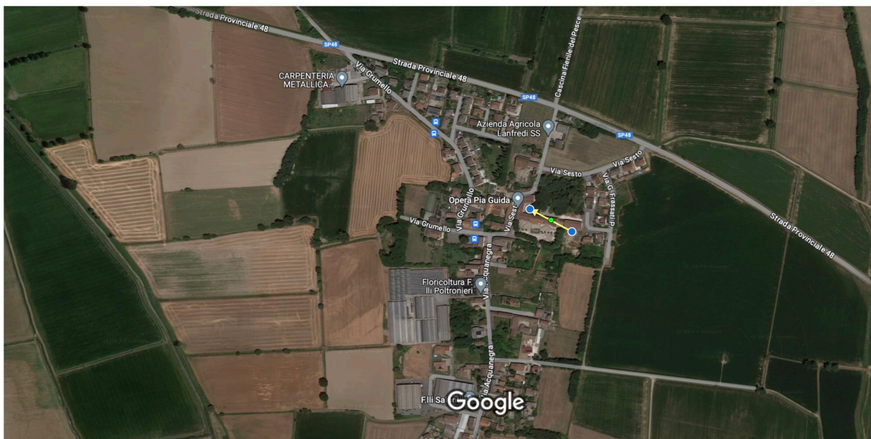
100 m